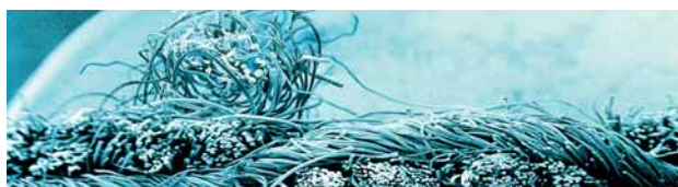
Pills – sie bilden sich während des Gebrauchs und machen ein Kleidungsstück rasch unansehnlich.

Selbst die besten Namen können sich dem inzwischen nicht mehr entziehen: Top-Designer verwenden Trevira Perform in ihren Kollektionen. Weil die Stoffe spezielle, auf molekularer Ebene modifizierte Hightech-Fasern enthalten, die Pillingprozesse erst gar nicht aufkommen lassen.