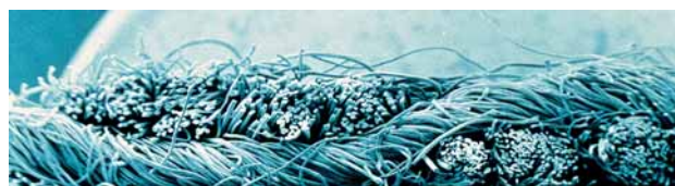
Trevira Perform stößt Pillknoten ab. Eine zusätzliche Ausrüstung ist nicht notwendig.