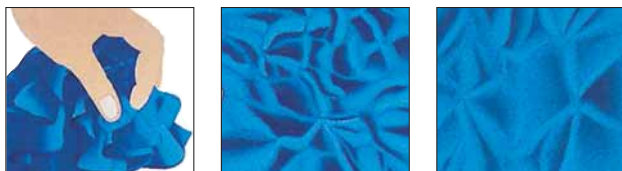
Beweis im Zeitraffer: Trevira Perform glättet sich von selbst.

Elasthane sind allgegenwärtig, aber ihre extreme Dehnbarkeit gerät außer Kontrolle, wenn sie nicht von anderen Textilfasern eingefangen wird. Trevira Perform ist der perfekte Mix-Partner für Stretch.